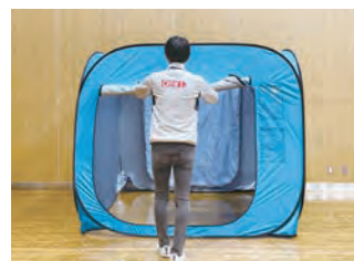
8 出入り口ファスナーを開け、上部にまともめます。