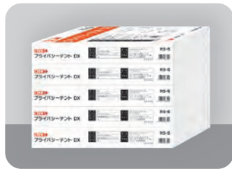
省スペースで保管できます