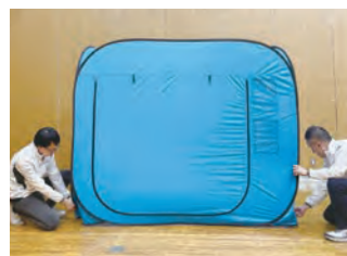
7 綺麗な正方形になるように、形を整えます。