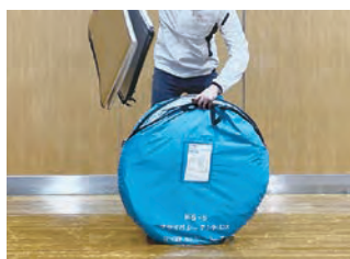
1 袋からテント・アルミマット・小物袋を取り出します。