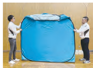
4 上下の向きを確認して立てます。