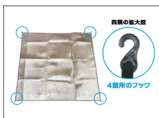
9 付属のアルミマットを用意します。