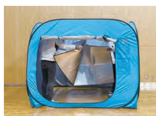
10 アルミマットを敷きます。