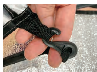
11 マットのフックをテントの四隅に固定します。