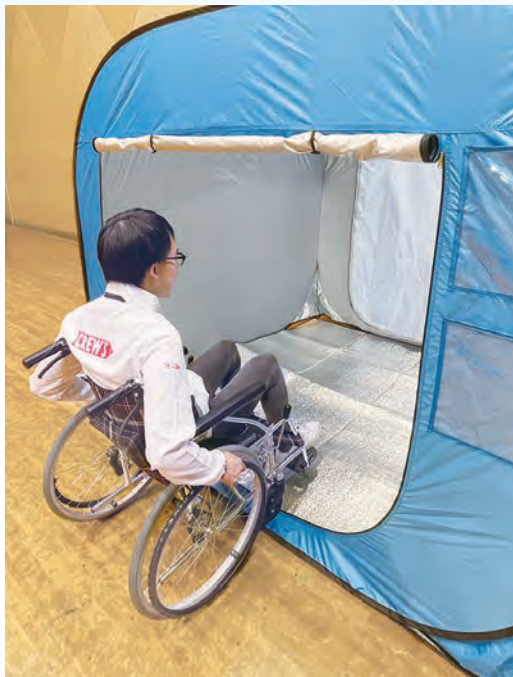
車椅子で出入り可能です