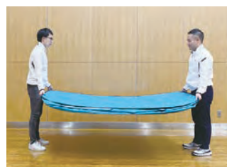
3 広げたテントを水平にします。