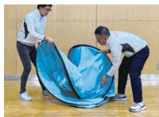
2 テントが勢いよく広がらないようにゆっくりと広げます。