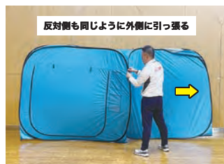
6 一直線に広げたら、中心部分を対角線上に引っ張り、正方形になるように広げます。