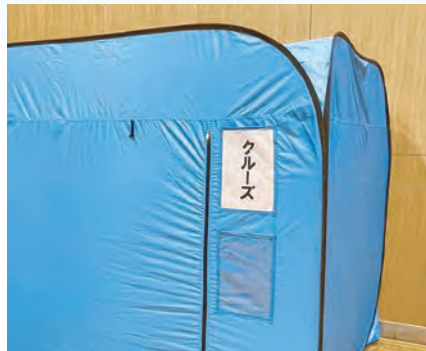
2つの表札入れがあります