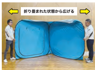
5 両端を持って一直線になるように広げていきます。