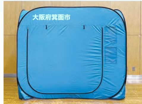
市町村名の名入れもできます