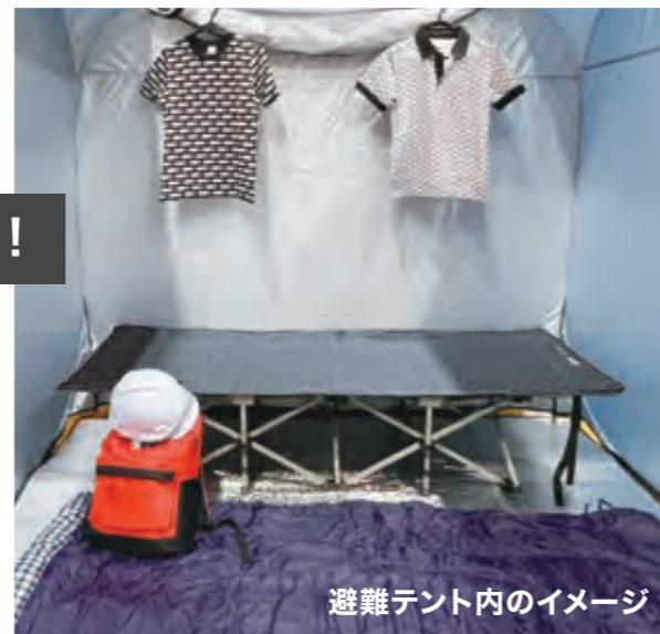
避難テント内のイメージ